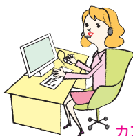
カスタマーセンター