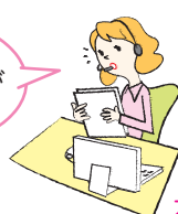
カスタマーセンター