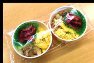
カップサイズ: 直径9cm×高さ4cm

【販売価格】 1パック2食入り540円(税別) ●3パック(1パック:同商品2食入り)以上からお届けします。14種類(裏面掲載)の中から好きな商品を3パック以上お選びください。